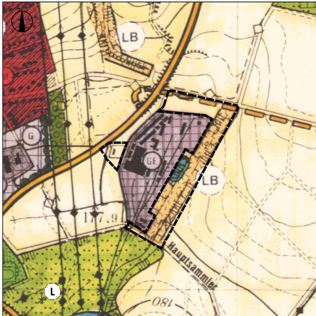
VOR DER ÄNDERUNG Maßstab 1:7.500